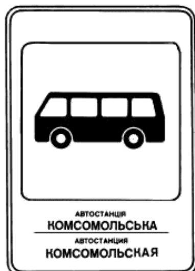
5. Указатель остановки междугородных автобусов