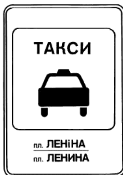
7. Указатель остановки легковых такси