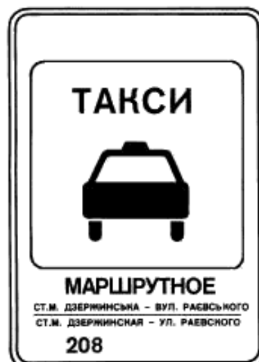
6. Указатель остановки маршрутных такси